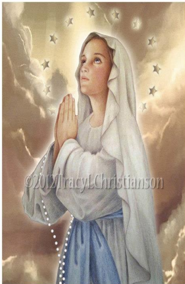
Svoga Sina Gospodina i Otkupitelja našega.. Amen

O Marijo, Majko Božja, Ti koja znaš za jade i nevolje ovoga svijeta, bdij bez prestanka nad nama i nad cijelom crkvom svoga Sina i budi nam uvijek našom Gospom brze pomoći. Pohiti da nam pomogneš u svim našim potrebama, posebno ....., budi nam utočište za ovoga prolaznog života i isprosi nam život vječni, po zaslugama Isusa,