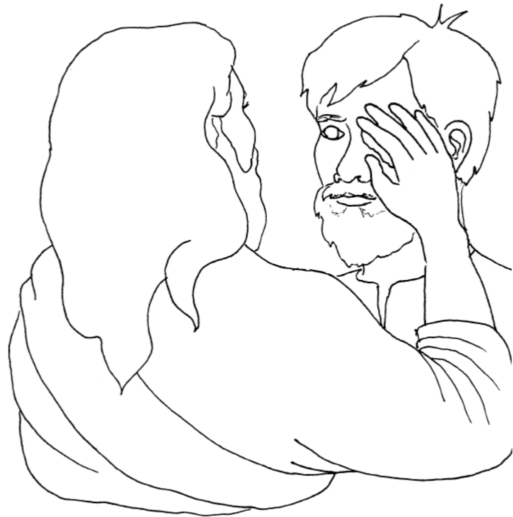
"Jesus anoints the blind man's eyes with clay." John 9:6

Još je gora sljepoća kada je u pitanju Bog. Vidimo li Boga u našem životu, da je On tu i da djeluje? Mi smo bilo gdje na površini, na vanjštini, a on je u našoj sredini, u našem srcu. Ali smo slijepi i vjerujemo da vidimo. O, kad bismo htjeli priznati da